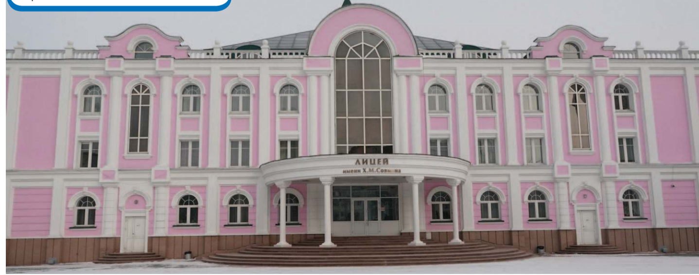
Дом лицей им. Х.М.Совмена.